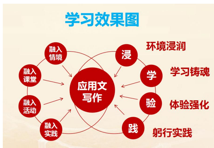
图 8 学习效果图

本课程根据学生的实际情况，采用灵活多样的教学手段，因材施教，营造良好的课堂教学气氛，充分调动学生听课的积极性，通过班级优化大师平台来改进学生平时成绩的评分方法，有效培养学生的学习兴趣，教学效果良好。