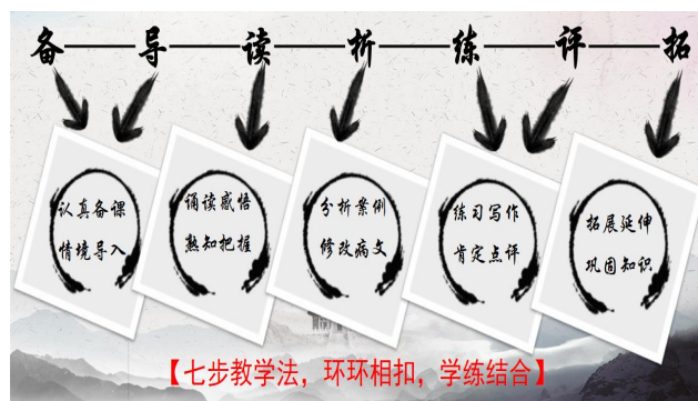
图 10 七步教学法

以采访、问答、设疑、招聘、视频、故事等题材的微课呈现形式，设置情景导入，引出各模块的概念、作用和特点；然后通过熟读概念、作用和特点，选取与学生学习生活、职业生涯等紧密联系的应用文6个模块的文种，在教学中以“ 备——导——读——析——练——评——拓 ”等“ 七步教学法 ”进行课堂教学，由浅入深进行能力的培养，引导学生快速、全面地学习。通过“七步教学法”的教学方式来激发学生的学习兴趣，达到易学、乐学、好学和实用易记的效果；例文新颖、规范、典型，知识面宽，具有鲜明的时代性和职教特色，实用性强。让应用文写作摆脱艰涩高冷的面孔，学生乐读、乐写、乐学。