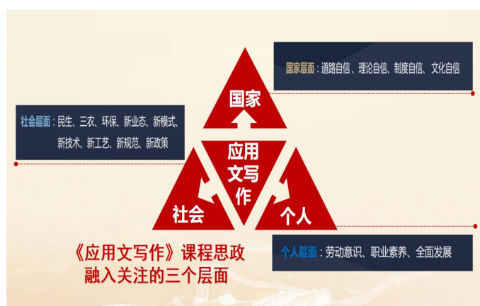
图 9 《应用文写作》思政关注点