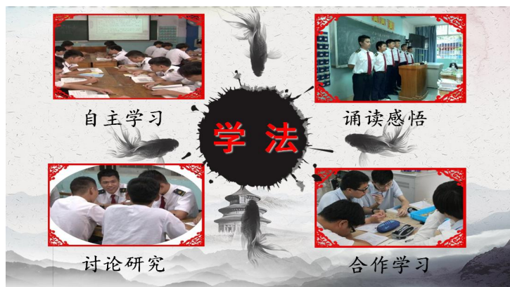
图 5 教学方法