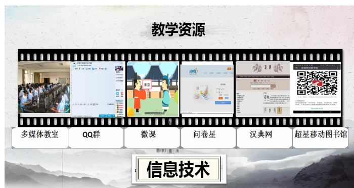
图 7 教学资源