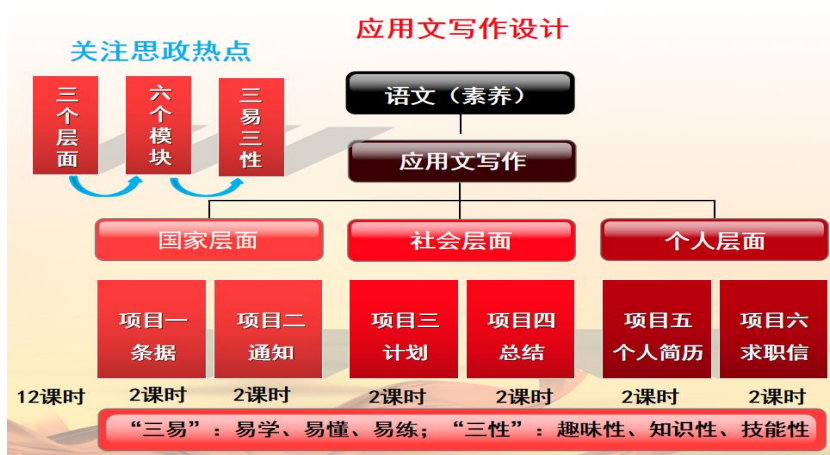
图 1 《应用文写作》六个教学模块设计内容

作品《笔耕不辍翰墨扬》是语文职业素养中《应用文写作》的其中 6 个教学模块，它是航海类专业学生的公共基础课程，可融入语文教学开设于第二个学期。课程根据教育部颁发的中等职业学校管理类专业教学标准，全面贯彻党的教育方针，落实立德树人的根本任务，进一步培养学生掌握基础知识和基本技能，强化关键能力，使学生具有较强的语言文字运用能力、思维能力和审美能力，传承和弘扬中华优秀传统文化，接受人类进步文化，汲取人类文明优秀成果，形成良好的思想道德品质、科学素养和人文素养，为学生学好专业知识与技能，提高就业创业能力和终身发展能力，成为全面发展的高素质劳动者和技术技能人才奠定基础。