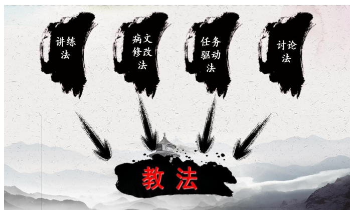
图 6 学习方法

3、教学内容：本课程共选取 6 个模块共 12 学时 具体教学内容及要求见下表：